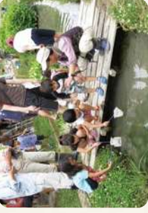
田んぼで生きもの探しをしたよ

市民・事業者・学校など、多くの皆さんと連携し、取組を支える担い手づくりを進めます。