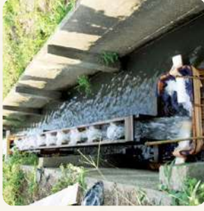
魚が田んぼと水路を行き来するための「魚道」

たくさんの生きものが生息できる環境づくりを進め、人にも生きものにもやさしい自然環境の保全・再生を進めます。