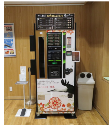
コウノトリデザインです

夏休みに入り、ぬりえコーナーはサマーバージョンになりました。地味な変更点ですが、コウノトリだけでなくカブトムシのぬりえも追加中！ご来館の際は、童心に帰りぜひぬりえに挑戦してみてくださいね。