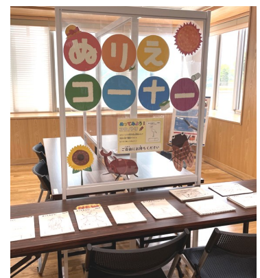
サマーバージョン！