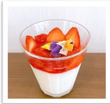
エディブルフラワーを使用した 季節のパンナコッタ