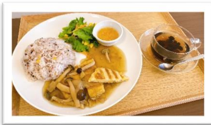
もっちり里芋の あんかけハンバーグ