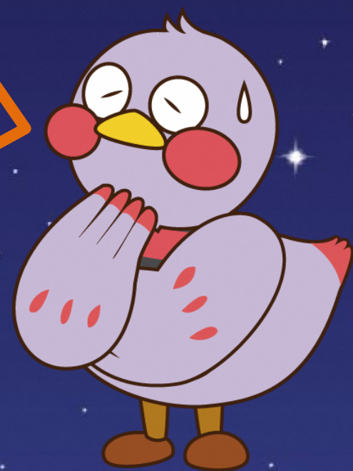
埼玉県マスコット 「さいたまっち」

こころに関する相談内容を何でも受け付けます。 悩みがあれば気軽に相談してみてください！