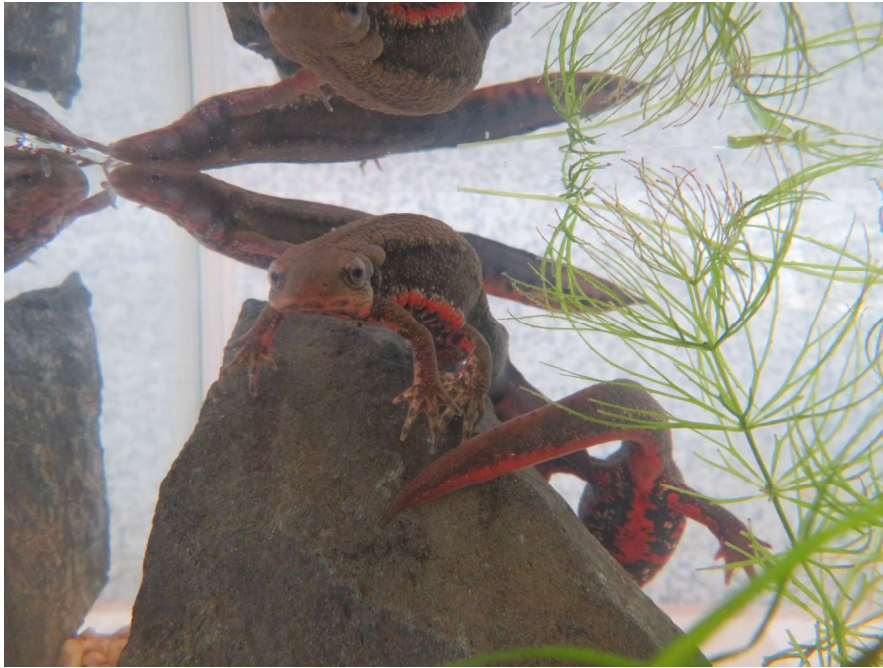
アカハライモリ、よくみるとカエルのような顔をしています

もし野外や動物園などでイモリとヤモリを見かけたら、この覚え方を思い出してみてくださいね！