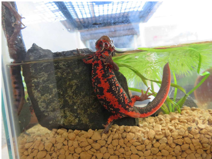
お腹の模様は個体によって違います