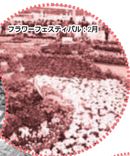
フラワーフェスティバル:2月