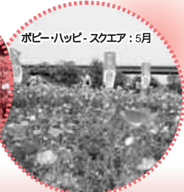
ポピー・ハッピー・スクエア:5月