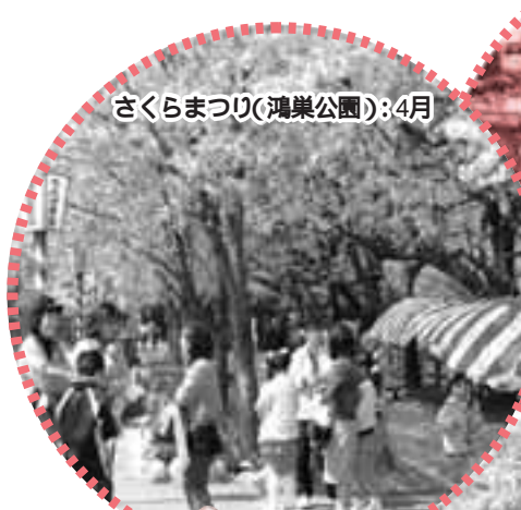
さくらまつり(鴻巣公園):4月