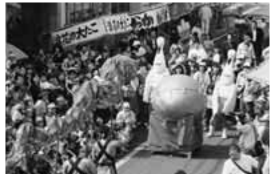
このとり伝説パレード

申込み・問い合わせ / 9月10日(月)までに鴻巣市商工会(☎541-1008)