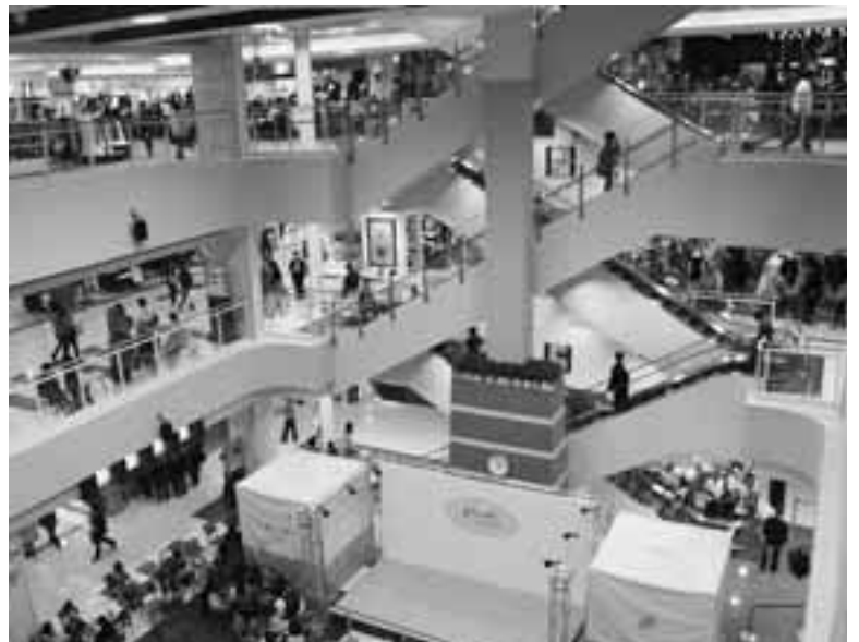
明るい雰囲気の内店