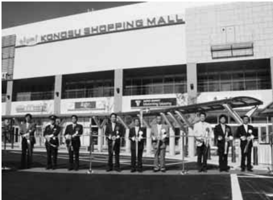
新しい鴻巣の顔が誕生しました

10月21日に鴻巣駅東口駅前広場開通記念式典が行われ、22日から駅前広場と関連道路が供用開始となりました。また、25日には、エルミこうのすショッピングモールのオープニングセレモニーが行われ、新たな鴻巣市の幕開けとなりました。開店直前には、期待に胸をふくらませた皆さんが長蛇の列を作り、開店と同時にたくさんの来店者でにぎわいました。