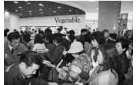
大にぎわいの店内