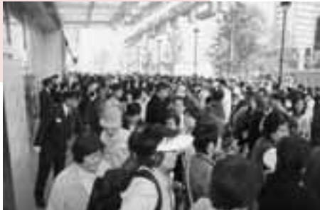
開店を待ちわびる皆さん