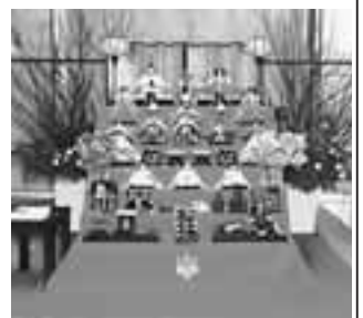
総理大臣官邸に飾られたお雛さま