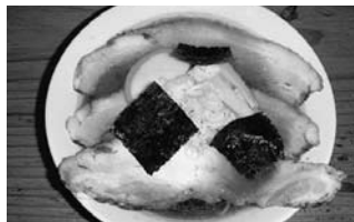
北海道ラーメン (神明3丁目)