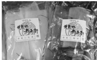
つけしん (本町1丁目)