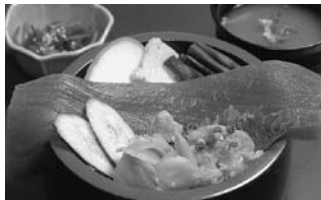
ご馳走Dokoroかねはち (寺谷)