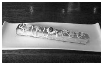
ギャラリーカフェ「ストーク」 (人形4丁目)