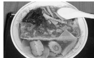
福ちゃん (本町8丁目)