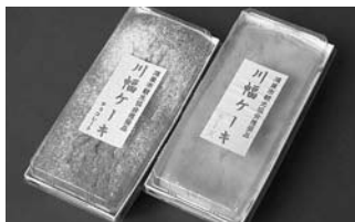
サッシーのぐち (本町1丁目)