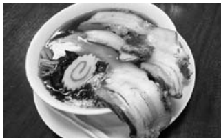
中華料理かすみ (天神5丁目)