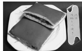
大和屋製菓 (東1丁目)