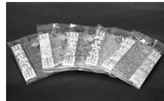
本手焼おとり (人形2丁目)