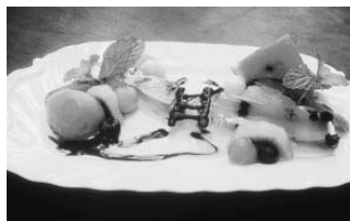
メイキッス (本町4丁目)