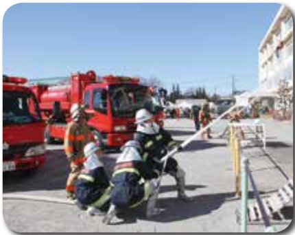
▲建物火災等消火訓練